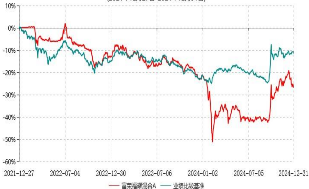
富荣福耀混合C累计净值增长率与业绩比较基准收益率历史走势对比图