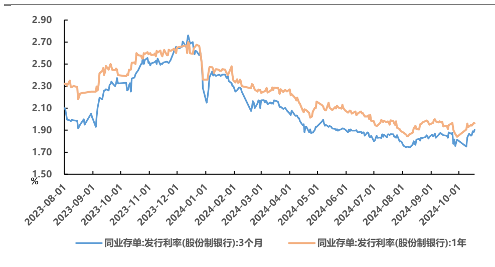
图 1、存单一级发行利率

上周主要银行同业存单发行总额为 6103 亿元，净融资额为 1116 亿元，发行规模增加，净融资额增加。发行利率方面，各期限的发行利率上行，1 月期、3 月期、6 月期、9 月期、1 年期发行利率分别变动+1.31BP、+3.66BP、+2.27BP、+4.00BP、+2.75BP 至 1.8869%、1.903%、2.024%、1.940%、1.961%。二级市场方面，1 月期、3 月期、6 月期、9 月期、1 年期发行利率分别变动-0.13BP、-3.23BP、-0.33BP、-0.43BP、-0.25BP 至 1.744%、1.864%、1.930%、1.930%、1.933%。