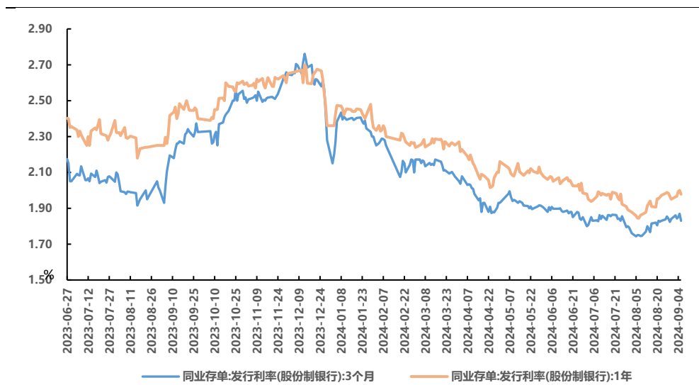
图 1、存单一级发行利率

上周主要银行同业存单发行总额为 6633 亿元，净融资额为 4822 亿元，发行规模增加，净融资额增加。发行利率方面，各期限发行利率上行，1M、3M、6M、9M（股份行）、1Y（股份行）发行利率分别变动 6.3bp、3.5bp、1.6bp、1.5bp、2.9bp 至 1.9%、1.9%、2.1%、2%、2%。二级市场方面，1M、3M、6M、9M、1Y 存单收益率分别变动 11.83bp、2bp、0bp、-0.24bp、-0.5bp 至 1.86%、1.88%、1.96%、1.97%、1.97%。