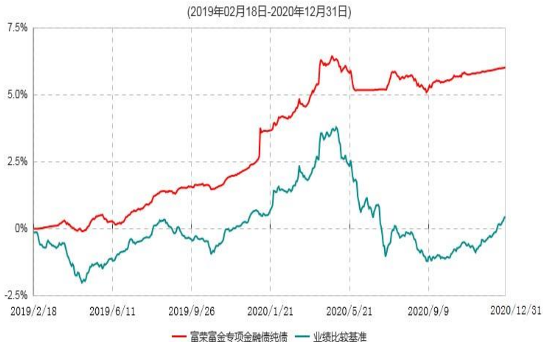
富荣富金专项金融债纯债债券型证券投资基金累计净值增长率与业绩比较基准收益率历史走势对比图